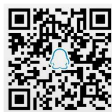
外泌体研究交流群